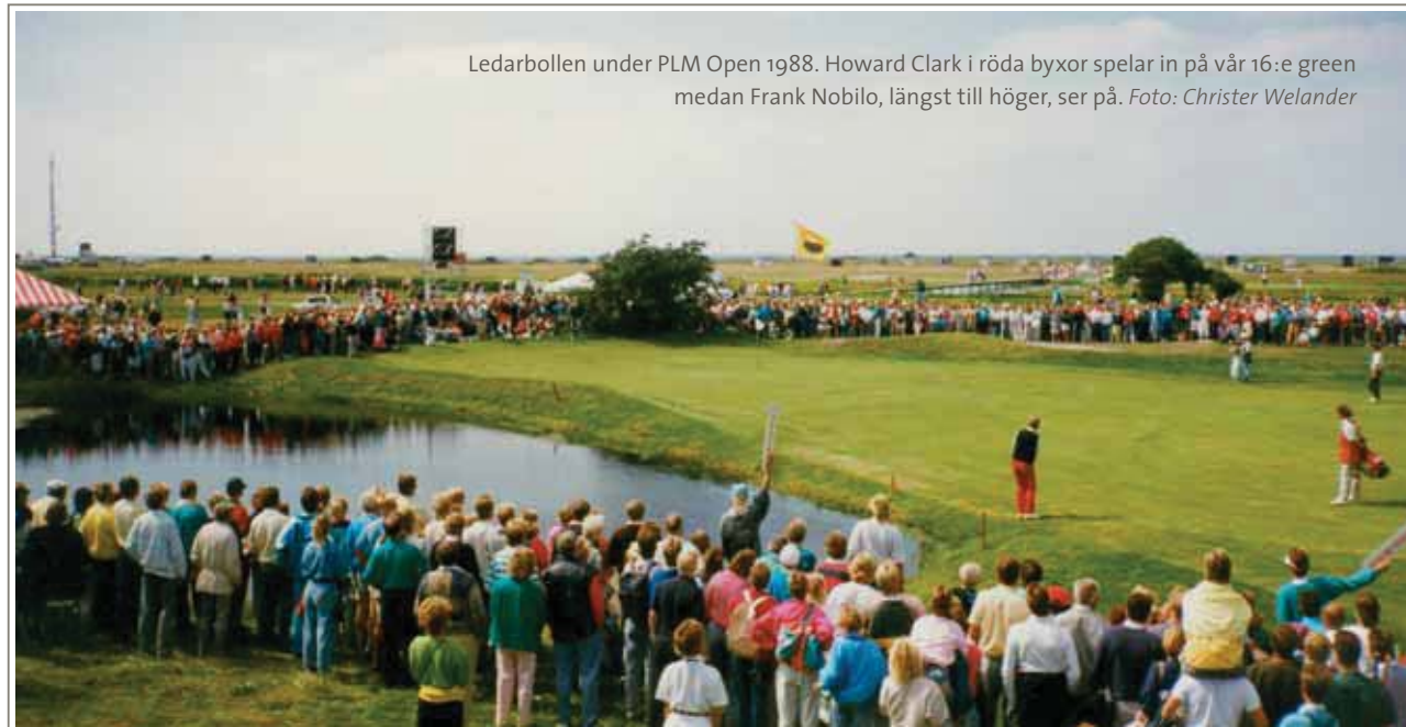
Ledarbollen under PLM Open 1988. Howard Clark i röda byxor spelar in på vår 16:e green medan Frank Nobilo, längst till höger, ser på.