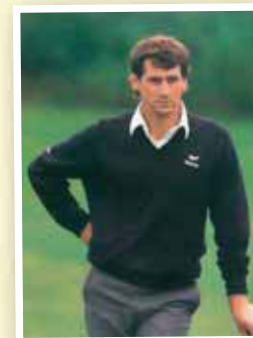
Kind regards Frank Nobilo

Frank är en av Nya Zeelands bästa golfare någonsin, numera arbetar han som tv-kommentator för en golfkanal i USA.