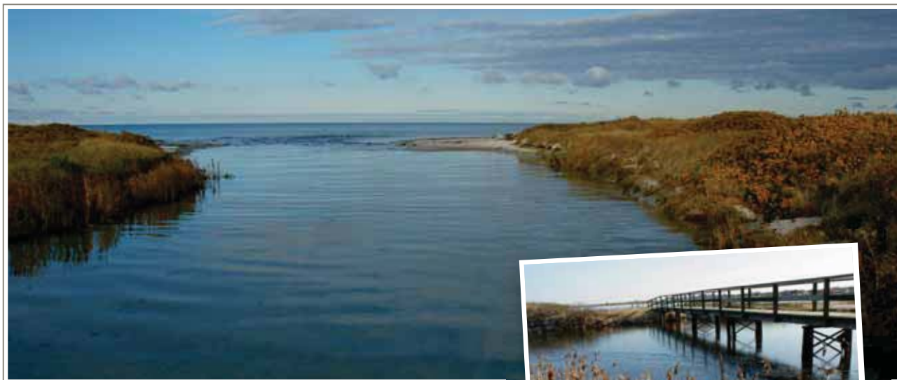
Slusan öppen. Varken lågvatten eller högvatten. Infällt: Bron över Slusan där kommunen vill bygga en sluss.

Kanske hade man liknande erfarenheter redan under Hansatiden då handelsfolk från hela Östersjön samlades i tusentals till sillmarknad i Skanör och Falsterbo? Kan det vara redan då som Flommen fick sitt namn? Ingen tycks veta. Men fantasin kan få flöda.